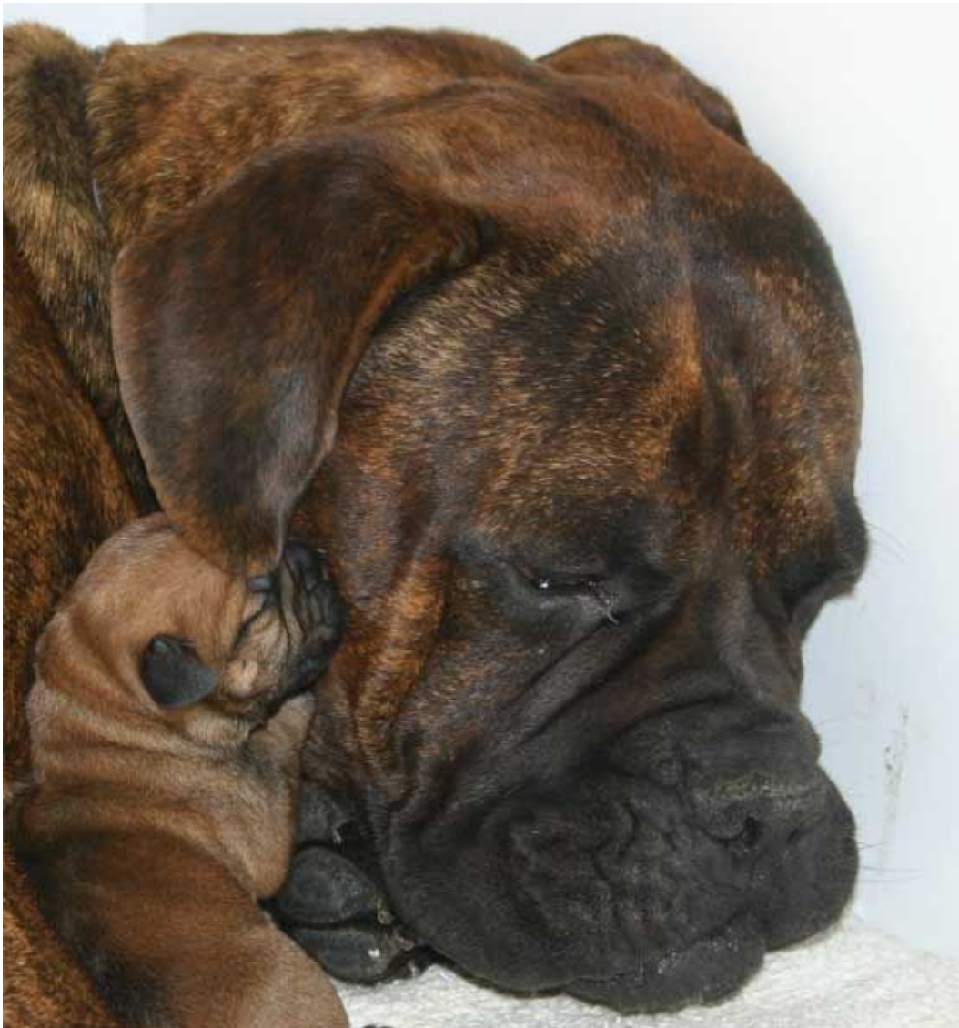
Gorda y Bosley de Castro-Castalia

De su capacidad de integración social y de identificación plena como especie, se deriva su facilidad futura para convertirse en un animal que pueda vivir sin problemas en nuestro mundo, en nuestra propia estructura social.