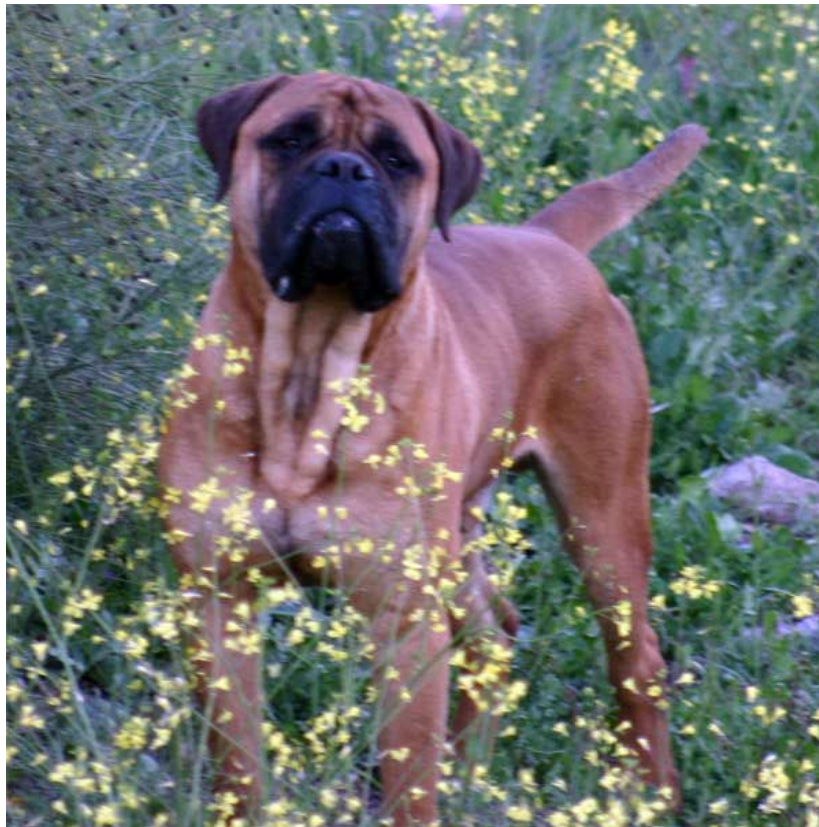
Piojo Arrimao de Castro-Castalia

Claro está que de vez en cuando (una vez al año por país) hay exposiciones monográficas de cada raza, pero no dejan de ser una repetición de las exposiciones de belleza habituales, estaría bien que algún día, esas exposiciones se utilizasen para poder ver cada raza como se merece y se viese, DE VERDAD , si los perros presentados son dignos representantes de su raza en todos los aspectos.