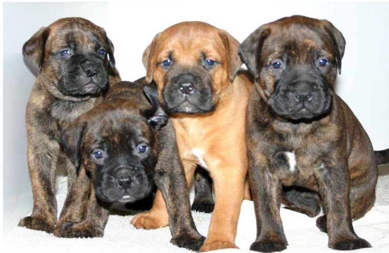
Camada X-Men de Castro-Castalia (Logan, Picara, Fenix y Tormenta)